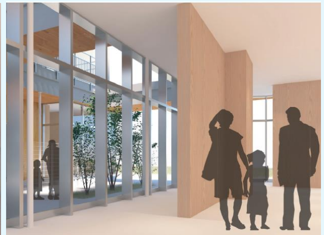
計画中のイメージ図 みんなの小路